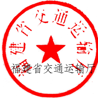
福建省交通运输厅