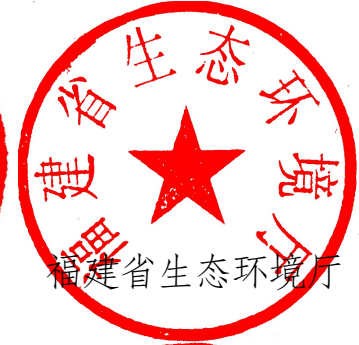
福建省生态环境厅