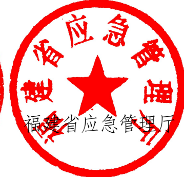
福建省应急管理厅