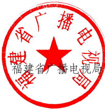
福建省广播电视局